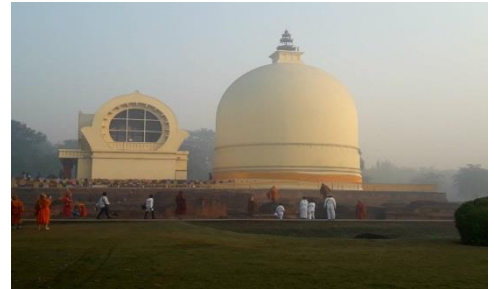
พุทธสังเขนียสถานที ๒ ปรินิพพานสถูป (สถานที่ปรินิพพาน )

นำท่านเข้าสักการะ ปรินิพพานสถูป สถานที่ดับขันธปรินิพพาน ณ สาถวโนทยาน หรือป่าไม้สาละที่พระพุทธเจ้าเสด็จดับขันธปรินิพพานและเป็นสถานที่ถวายพระเพลิงพระพุทธเจ้า ร่วมกันสวดมนต์บูชา และถวายผ้าห่มองค์พระพุทธรูป ปรินิพพาน