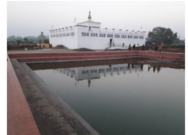
พุทธสังเวชนียสถานที่ ๓

นำทุกท่านสู่ สวนศักดิ์สิทธิ์ ลุ่มพินิวัน เป็นสถานที่ประสูติของเจ้าชายสิทธัตถะ ตั้งอยู่กึ่งกลางระหว่าง กรุงกบิลพัสดุ์ และ กรุงเทวทหะ ภายในสวนลุ่มพินิแห่งนี้มี "วิหารมหายาเทวี" ภายในประดิษฐานภาพหินแกะสลักพระรูปพระนางสิริมหามายาประสูติพระราชโอรส และชมสระ