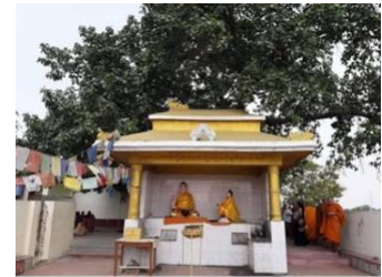
ต้นขอพาลนิโครธ

บ่าย นำท่านเยี่ยมชม ต้นขอพาลนิโครธ สถานที่ทรงรับข้าว มธุปายาสก่อนตรัสรู้ และเป็นสถานที่ทรงเสวยวิมุตติสุข